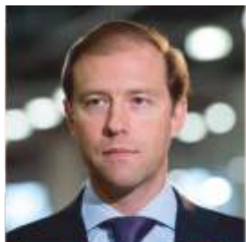
Мантуров Денис Валентинович Министр промышленности и торговли РФ