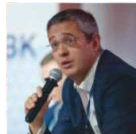
Повалко Александр Борисович Генеральный директор, председатель Правления АО «РВК»