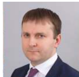
Орешкин Максим Станиславович Министр экономического развития РФ