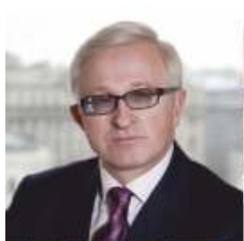
Шохин Александр Николаевич Президент РСПП