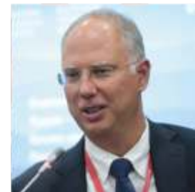
Дмитриев Кирилл Александрович Генеральный директор РФПИ