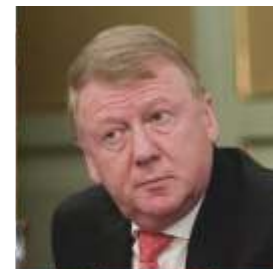
Чубайс Анатолий Борисович Председатель Правления ООО «УК «РОСНАНО»